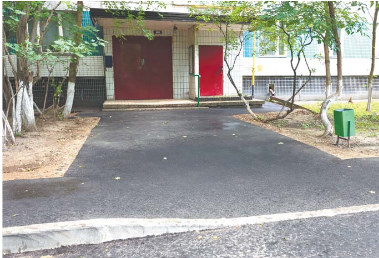
Асфальтируются тротуары и подходы к подъездам. Ул. Сакко и Ванцетти, д. 30, 32

– Наш двор всегда выглядел заброшенным, но в прошлом