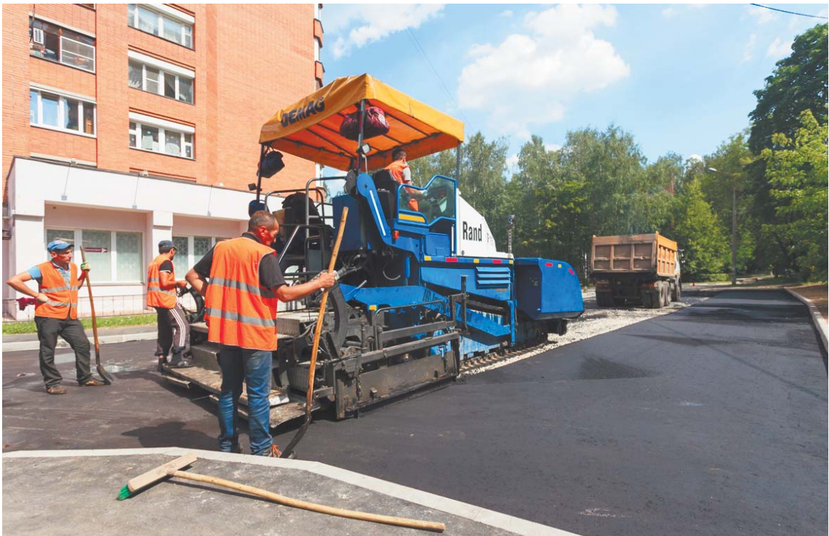
Во дворе домов № 2, 4, 6 по пр. Циолковского укладывают новый асфальт

В Королёве, помимо шести обязательных элементов, предусмотренных требованиями губернатора, появляются собственные: устанавливается система видеонаблюдения на детских площадках, асфальтируются тротуары и подходы к подъездам, приводятся в порядок отмостки домов.