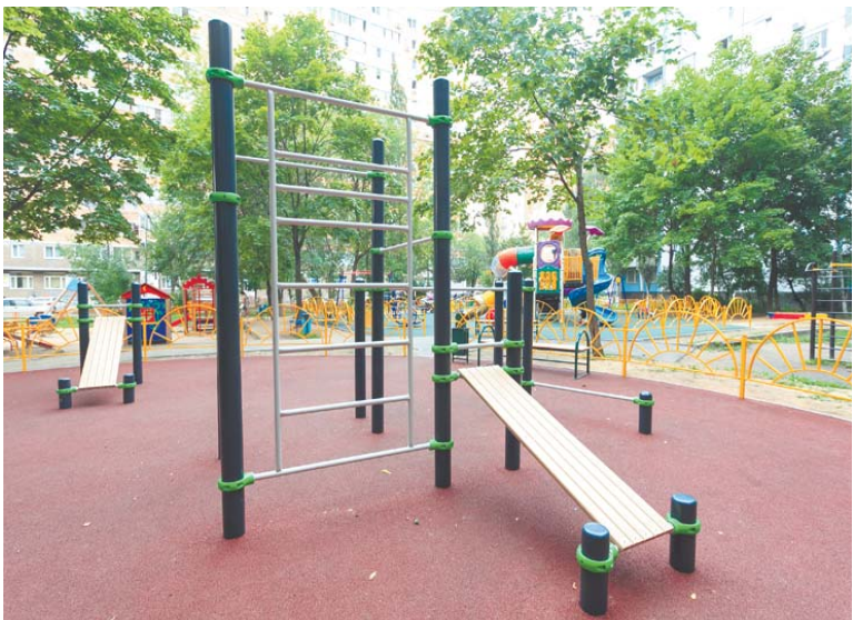
Спортивная площадка во дворе на пр. Космонавтов

желаний жителей, которые озвучиваются во время встреч с горожанами, поступают на электронную почту и личный инстаграм главы, оформляются в качестве заявок в Единую диспетчерскую службу.