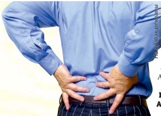
Изображение рекламируемого аппарата

Вот опять «ПРОСТРЕЛИЛО» ПОЯСНИЦУ, ВОТ ОПЯТЬ РУКИ УТРОМ КАК ЧУЖИЕ, ОНЕМЕВШИЕ, НЕЖИВЫЕ... ВСЕ ЭТО ПРОЯВЛЕНИЯ ОСТЕОХОНДРОЗА ПОЗВОНОЧНИКА, КОТОРЫЙ ТАК И НЕ НАУЧИЛИСЬ ВЫЛЕЧИВАТЬ «НАСОВСЕМ»! ПЕРИОДИЧЕСКИ ОН ВОЗВРАЩАЕТСЯ, ЛИШАЯ ВОЗМОЖНОСТИ РАБОТАТЬ И СПОСОБНОСТИ РАДОВАТЬСЯ ЖИЗНИ!