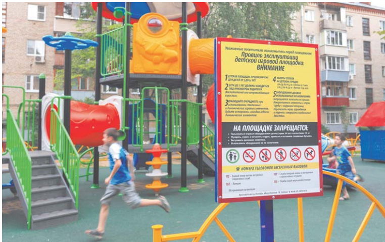
Детская площадка – обязательный элемент благоустройства дворов