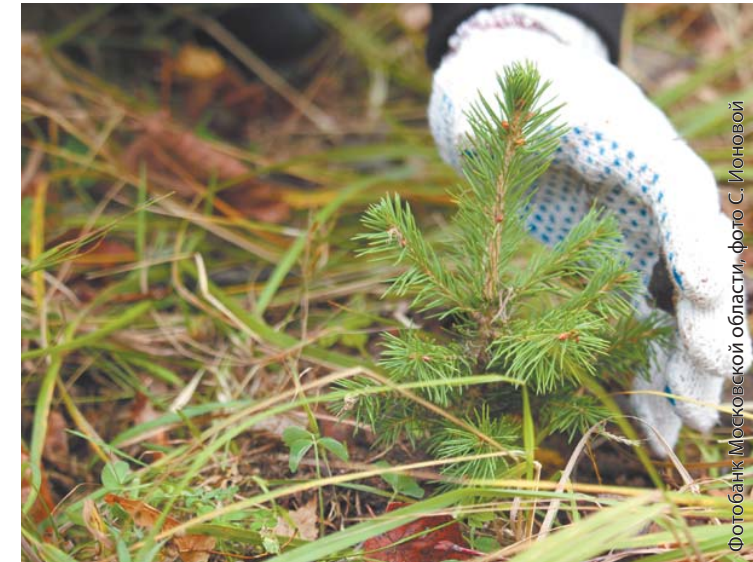
Крохотные сеянцы требуют ухода

Мероприятия по агротехническому уходу проводятся согласно заранее утверждённому плану, рейды по контролю за ростом и качеством посадок