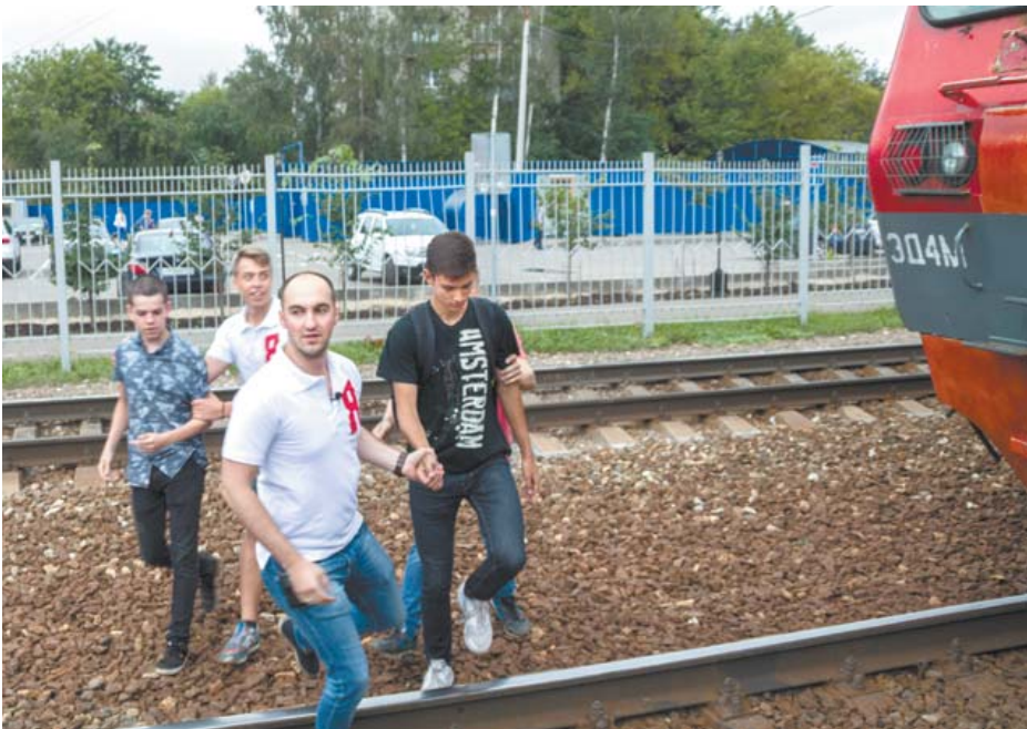
Активисты помогают полиции задерживать зацеперов

К тому же в России мало специалистов, которые занимаются проблемой предупреждения развития зацепинга в молодёжной среде. Сотрудники транспортной полиции, несмотря на принимаемые меры, в одиночку не смогут стабилизировать обстановку на железной дороге.