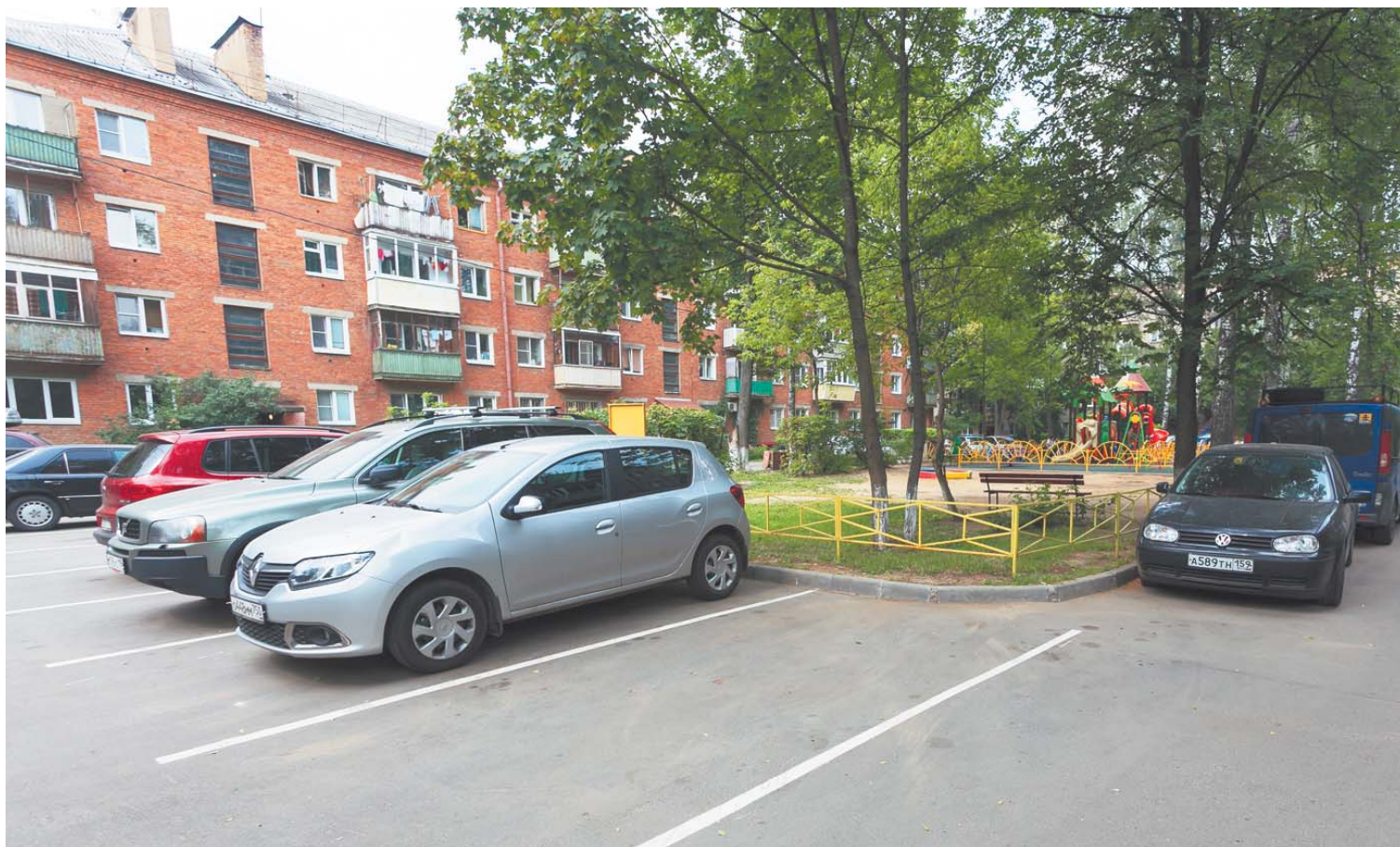
Во дворе домов № 18, 20 по ул. Декабристов есть место для отдыха с детьми и для парковки автомобилей

ОДНИМ ИЗ ПРИОРИТЕТНЫХ НАПРАВЛЕНИЙ РАБОТ В СФЕРЕ ЖКХ ПРАВИТЕЛЬСТВО МОСКОВСКОЙ ОБЛАСТИ СЧИТАЕТ БЛАГОУСТРОЙСТВО ДВОРОВ МНОГОКВАРТИРНЫХ ЖИЛЫХ ДОМОВ КАЖДОГО МУНИЦИПАЛИТЕТА. В КОРОЛЁВЕ ЭТОМУ ТАКЖЕ ПРИДАЁТСЯ БОЛЬШОЕ ЗНАЧЕНИЕ.