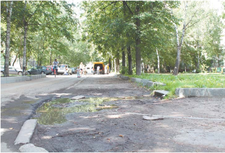
Двор дома № 36 по ул. Тихонравова явно нуждается в обновлении

«В каждом благоустраиваемом дворе мы соблюдаем все обяза-