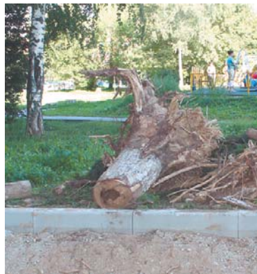
На спиле ствола видно, что ель была нездорова, но внешне это было неочевидно