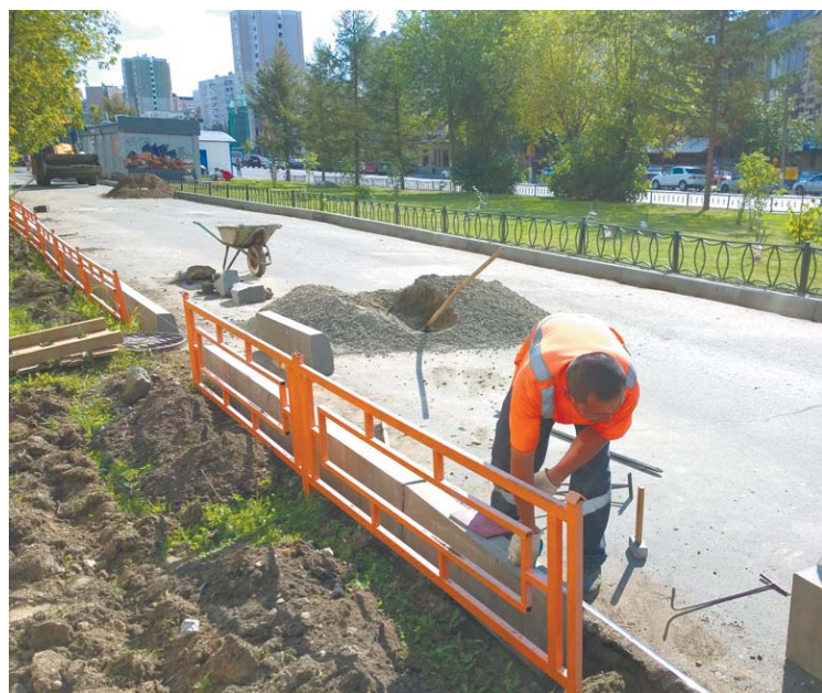
Укладка бордюрного камня у дома № 3 по пр. Космонавтов

Напомним, ежегодно в Московской области необходимо приводить в порядок 10% территорий вокруг многоквартирных жилых домов. Всего 1576 дворов в Подмосковье включены в план